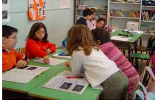
COOPERAZIONE NELLA CLASSE