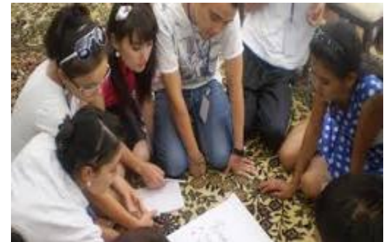
AZIONE SOLIDALE NELLA REALTA'